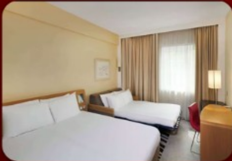
ที่พัก 4 ดาวทุกคืน