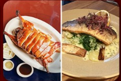
อาหารจีนเลิศ อิ่มอร่อยทุกมื้อ