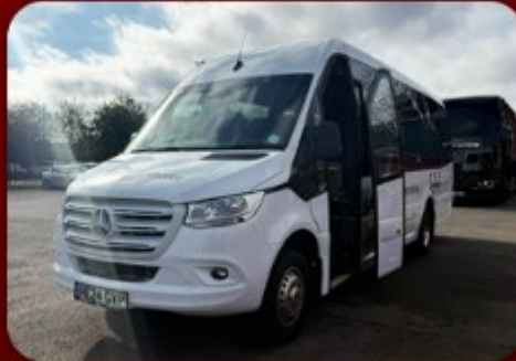
รถตู้ VIP บริการตลอดทริป